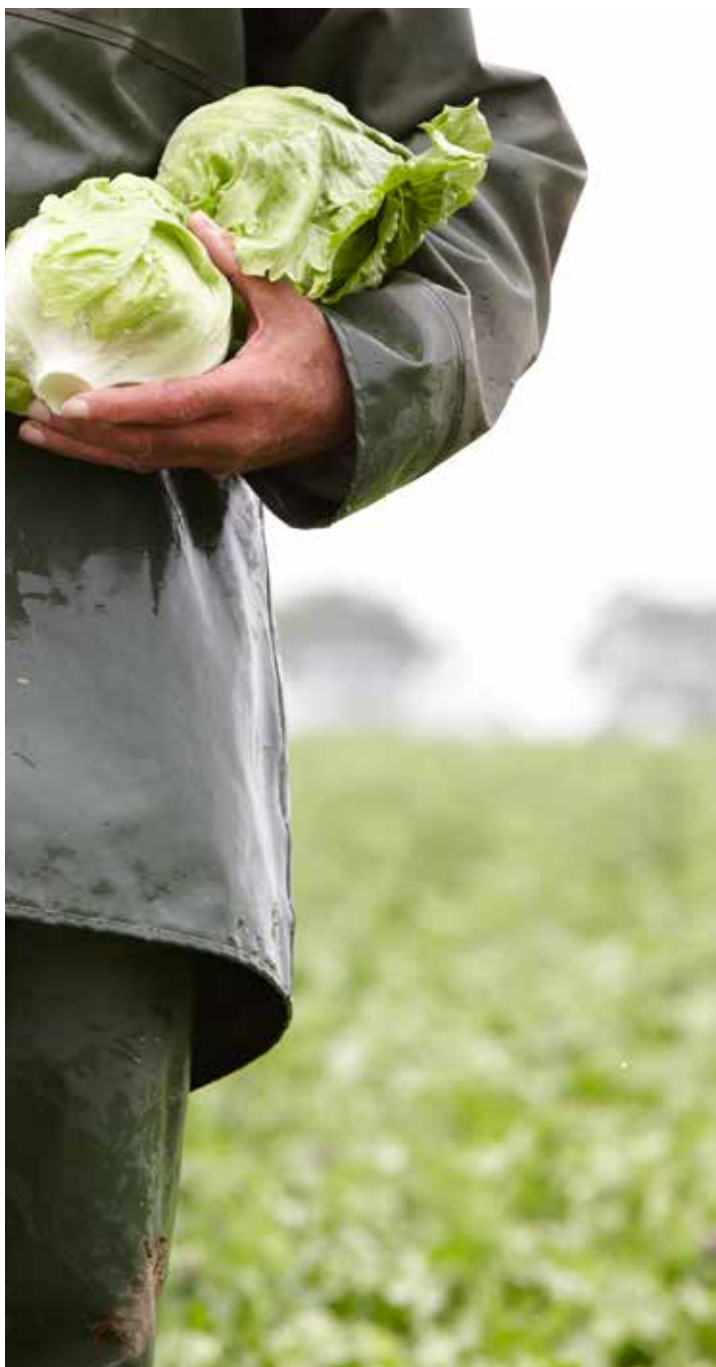
Kuvattu St. Pol de Léoniassa Ranskassa heinäkuussa 2008 maatilalla, joka tuottaa McDonald's-keijun tavarantoimittajille avomaatuotteita.