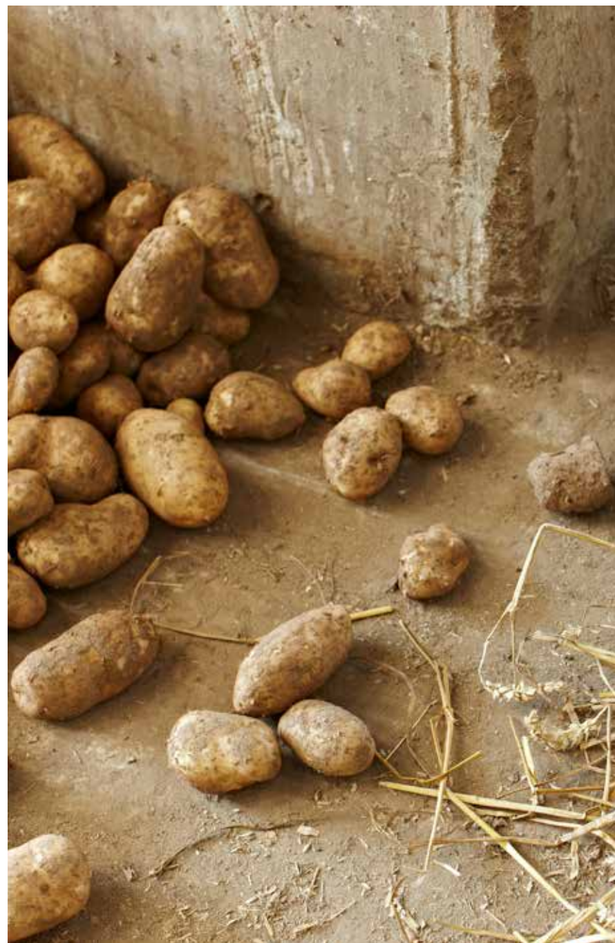
Kuvattu Ranskassa heinäkuussa 2009 maatilalla, joka toimittaa McDonald's-keijun perunatuotteiden valmistajille perunoita.

Sokeri, omenapyree (omena, sokeri), vesi, väkiviinaetikka, tomaattipyree, curry (2 %, sisältää sinappia ), suola (1,1 %), rypsiöljy, sakeuttamisaine (E415), mausteet, luontainen aromi. Tuote on gluteeniton ja laktoositon.