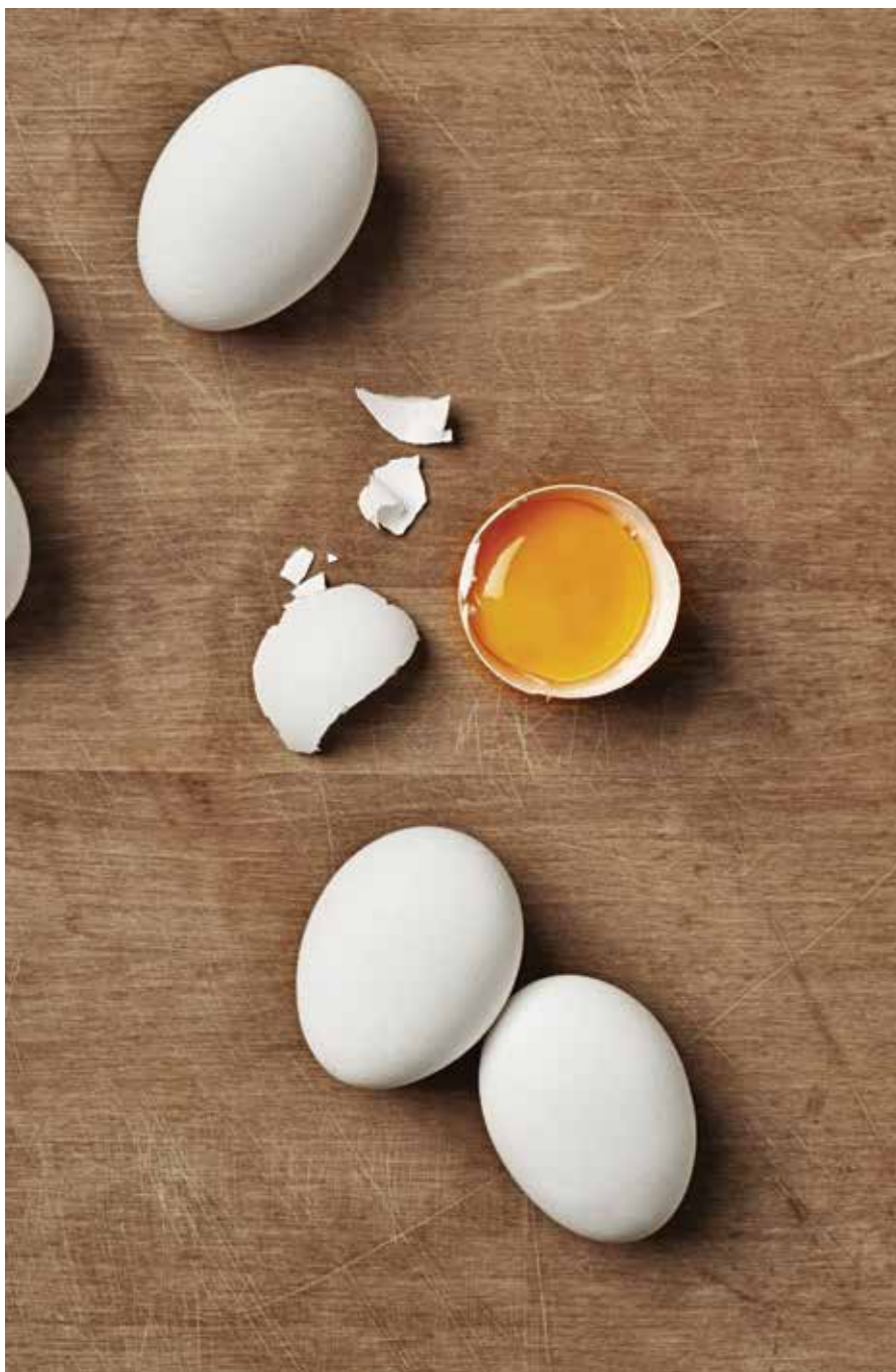
Lähtökanan luomunumunia, joita käytämme aamiaistuotteissamme.