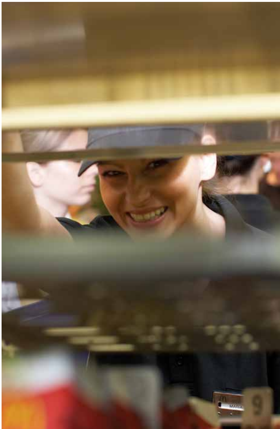
Kuvattu Münchenissä Saksassa huhtikuussa 2007 McDonald's-ravintolan keittiössä.