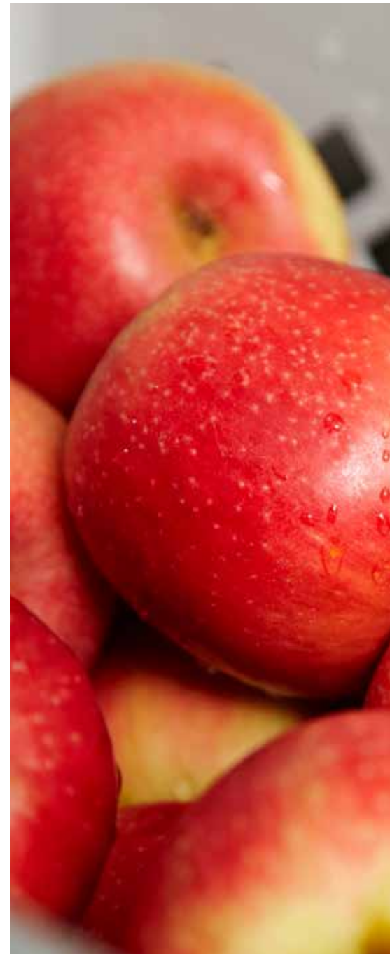
Kuvattu Ranskassa heinäkuussa 2009 tuotantolaitoksessa, joka toimittaa McDonald's-ravintoloille hedelmiä.

Makeutettu täysmaitotiiviste ( täysmaito , sokeri), sokeri, vesi, kookosrasva, vähärasvainen kaakaojauhe (5 %), muunnettu tärkkelys, suola (0,58 %), stabilointiaine (E331).