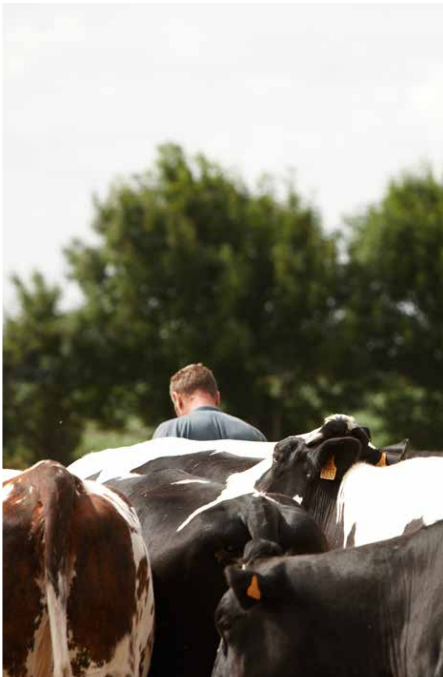
Kuvattu Le Neubourgiessa Ranskassa heinäkuussa 2008 maatilalla, joka tuottaa McDonald's-keijun tavarantoimitajille naudantihaa.