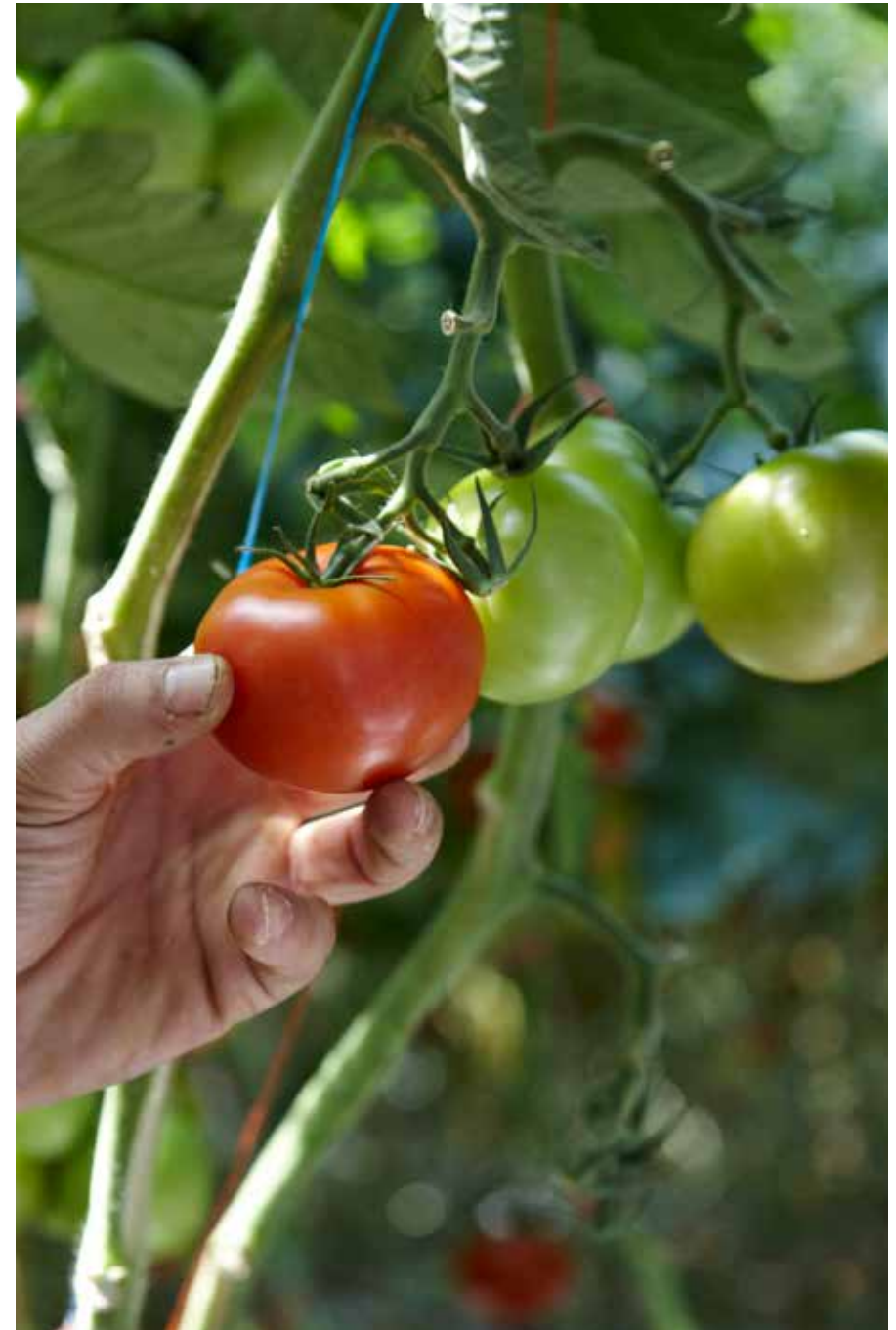
Kuvattu Marmnadessa Ranskassa heinäkuussa 2008 maatilalla, joka toimittaa McDonald's-keijulle tomaatteja.

Kanan rintafilee (93 %), vesi, perunatärkkelys, stabilointiaineet (E407a, E500, E331), aromit, maltodekstriini (perunasta), suola (1,2 %), sokeri, fruktoosi, karamellisoitu sokeri, sakeuttamisaine (E415). Lihan alkuperä EU-alue. Gluteeniton.