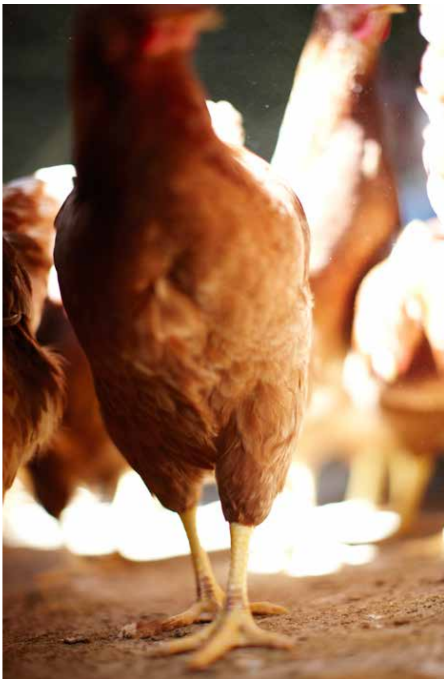
Kuvattu Le Neubourgiessa Ranskassa heinäkuussa 2008 maatilalla, joka tuottaa McDonald's-keijun tavarantoimittajille kanatuotteita.