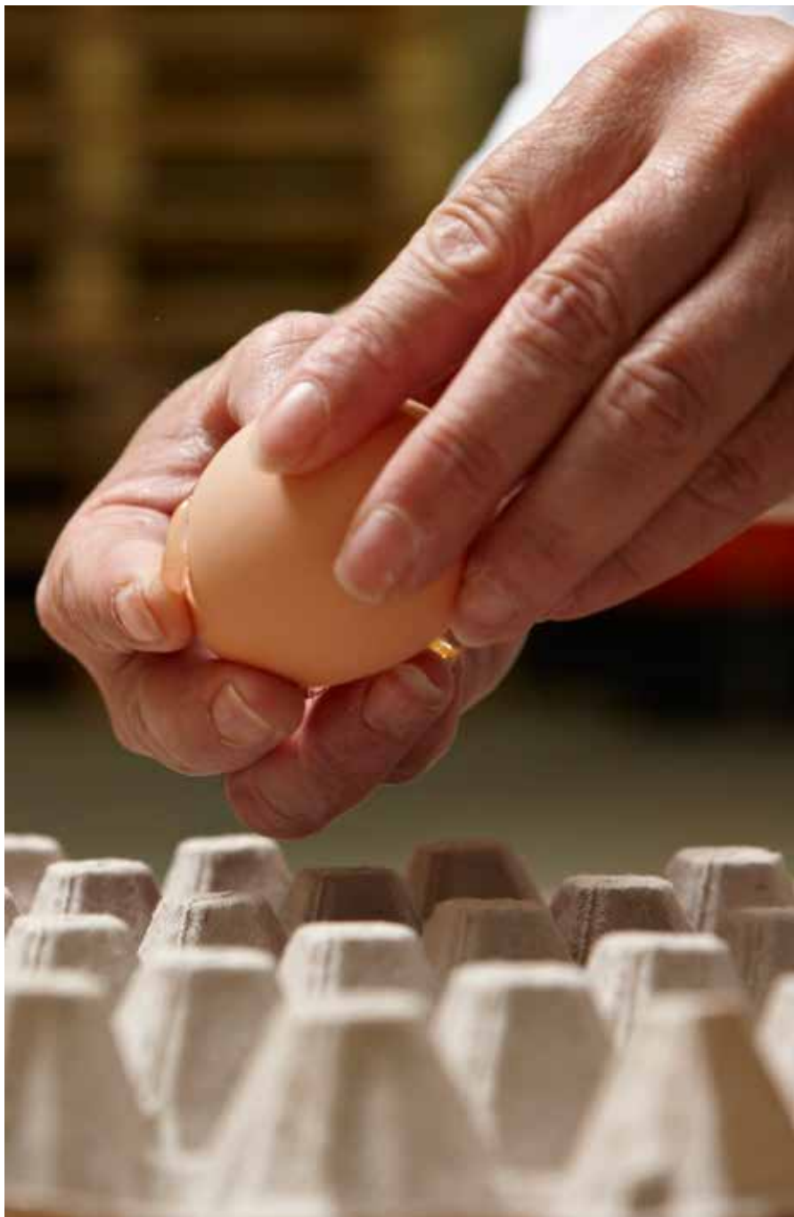
Kuvattu Ranskassa heinäkuussa 2008 muininkanalassa, joka toimittaa McDonald's-keijuille kananmunia.