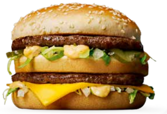
BIG MAC -KERROSHAMPURILAINEN

Vehnärtortilla ja tuotteen mukaan vaihtelevat täytteet. Tämänhetkisen valikoiman tiedot löydät kotisivuiltamme osoitteesta www.mcdonalds.fi