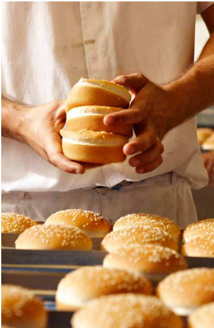
Kuvattu Ranskassa heinäkuussa 2009 leipomossa, joka leipoo McDonald's-keijulle sämpylöitä.